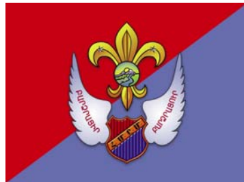
Հ. Մ. Ը. Մ.ի Սկառուտական Դրօշակը (Տես՝ յօդուած 9, էջ 12)