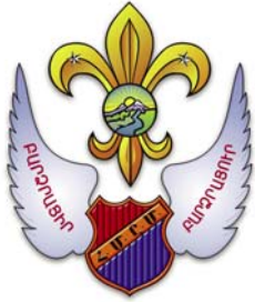
Հ. Մ. Ը. Մ.ի Շուշանաձաղիկը (Տես՝ յօդուած 157, էջ 50)